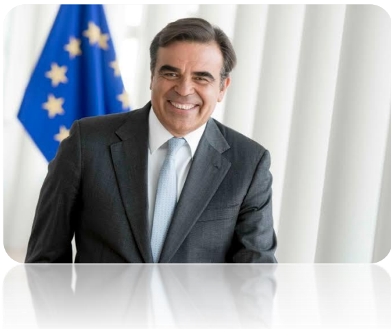
Маргаритис Схинас Заместник-председател на Европейската комисия

„Като европейски граждани, ние всички споделяме общи фундаментални ценности, които лежат в основата на ежедневието ни.